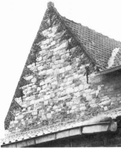
251. SART-LE-DIABLE, 1. Aile N. Pignon O. avec épis.