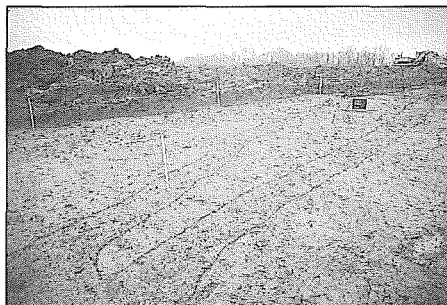
Deux fossés de la fin de La Tène III.

de 5 m traversait l'emprise. Une pièce de 10 centimes frappée en 1862 sous Léopold I er ainsi que des fragments de faïence retrouvés dans le comblement de la structure confirment une datation récente.