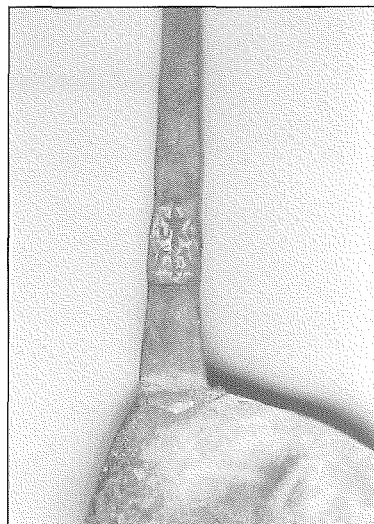
Détail de la cuillère.

Datation en fonction du contexte : seconde moitié du XV e siècle. ■ 1996