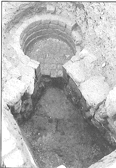
Un four métallurgique accolé à l'enceinte médiévale de Bouvignes-sur-Meuse.

En 1996, les terrassements engendrés par la construction des habitations sociales dans le secteur de l'enceinte dégagée en 1994 et 1995 (porte du Chevalier et tour Gossuin) ont nécessité un suivi de chantier à l'emplacement de l'atelier métallurgique étudié intra-muros. Les limites de celui-ci ont pu être précisées vers la rue Genard. ■ 1995-1996