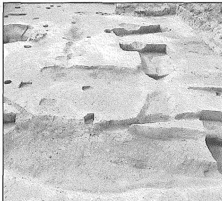
Baudecet : vue générale de la structure fossoyée antérieure au temple en pierre.