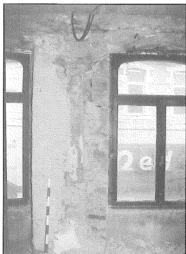
Colonne du XVI e siècle englobée dans la façade du XIX e siècle.