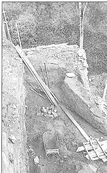
Vue du secteur dégagé.

Au cours des travaux de restauration du donjon, il s'avéra nécessaire de déblayer un secteur non touché par les fouilles du Service National des Fouilles, de 1973-1976 (MATTHYS A. & HOSSEY G., 1978. Le Château d'Herbeumont (Archæologia Belgica, 209), Bruxelles).