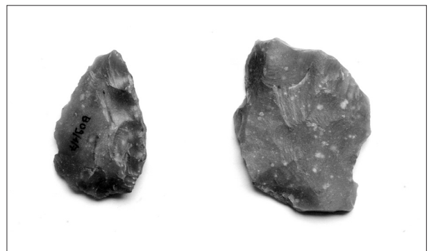
Armature amygdaloïde (long. 34 mm ; larg. 22 mm ; ép. 5 mm) et coche – bord droit – sur éclat en silex originaire du Grand-Pressigny (long. 40 mm ; larg. 32 mm ; ép. 7 mm).

Les prospections de 2009 ont permis de récolter 17 objets. Du matériel de débitage : 1 fragment de nucléus à éclats, 2 fragments distaux de lame et 9 éclats bruts dont 1 brûlé. Des outils : 1 microburin proximal, 1 fragment de petit grattoir semi-circulaire, 1 armature (?) losangique sur bord de hache polie, 1 armature amygdaloïde et 1 coche sur éclat. Les matières sont identifiées visuellement et se répartissent en silex de type Spiennes (7 objets), en silex de type Hesbaye (2 objets), en silex pressignien (1 objet) et en silex de type indéterminé (7 objets).