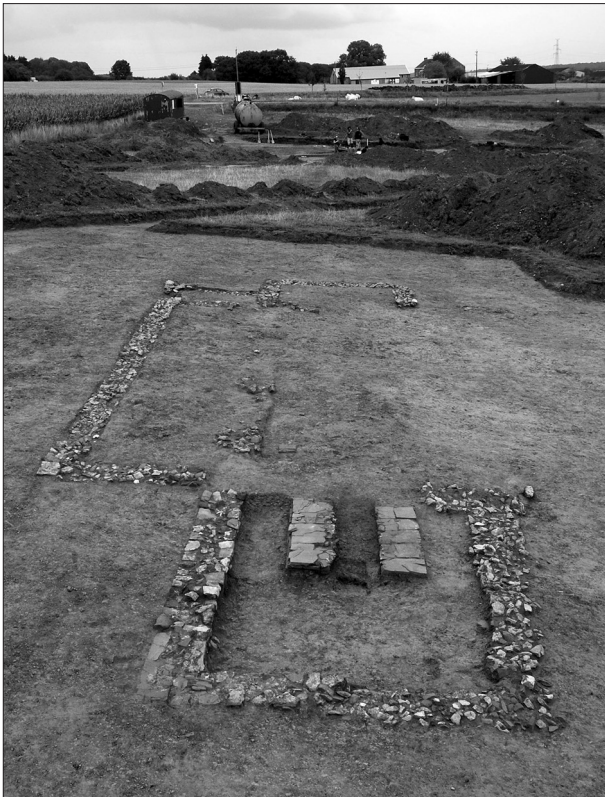
Vue du petit complexe de bains en enfilade.

seconde phase de construction et l'angle nord-ouest de la chambre de chauffe sera réaménagé à l'aide de tegulae .