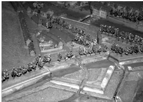
Détail du plan en relief de Charleroi par Montaignu (1/600) : vue de l'ouest, 1696, Musée des Plans en relief, dépôt au Musée des Beaux-Arts de Lille.

La place de la Digue se situe dans l'Entre-Villes, quartier développé entre la Ville-Haute et la Ville-Basse de Charleroi dès le 17 e siècle (Caroloiregium, 1967). La porte de Dampremy, permettant d'accéder à l'Entre-Villes par l'ouest, se retrouve à la limite sud de l'emprise des travaux. Elle se matérialise par un ressaut oblique aménagé dans le parement du mur d'enceinte. Une courte section de la voirie pavée traversant la porte est également mise au jour. Un pont, enjambant le fossé, reliait la porte de Dampremy à la route menant à Mons. Les cinq piles du pont, conservées sur 1,50 à 2,20 m de