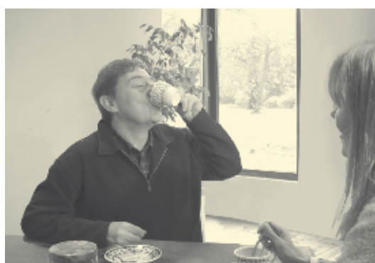
Son chauffage lui coûte le prix d'un café par mois.