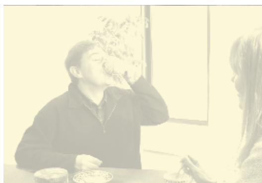
Une fiction ? Non. Et ça se passe près de chez vous.

L'axe principal constitué par l'Allée aux Oiseaux est conservé. L'implantation des groupes de maisons se fait autour de placettes principalement piétonnes. La majorité des logements est reliée au parc. Un green est implanté entre les deux tours qui seront maintenues et le parc. Une place minérale à l'échelle du quartier est installée en bout de perspective de l'Allée aux Oiseaux.