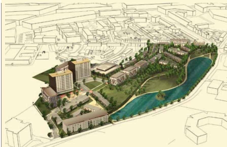
Implantation du quartier dans la trame urbaine

L'équilibre financier final du projet nécessitera encore de trouver des sources de financements à hauteur de +/- 2 millions EUR pour la construction des voiries, des réseaux et pour le financement de l'indexation des prix sur la durée du chantier.