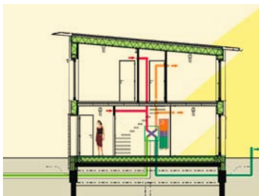
Coupe maison passive type