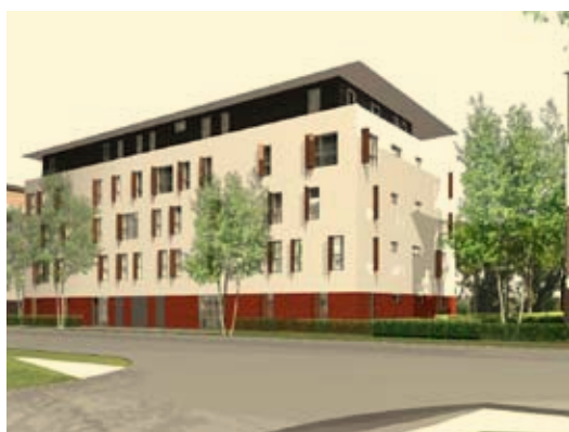
Immeuble de promotion basse énergie K23

Réaliser ces logements sociaux passifs, avec l'engouement que cela suscite, signifie le retour d'un temps pas si lointain où le logement social servait d'exemple de développement architectural.